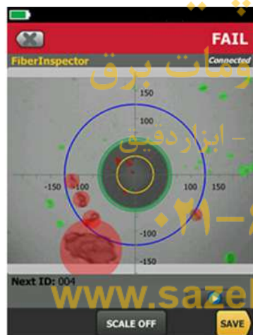
Defects that fail the standard's requirements are colored Red

Optez pour une certification des extrémités des fibres optiques conforme aux normes du secteur - CEI 61300-3-35. Ou si vous le souhaitez, vous pouvez évaluer manuellement les extrémités.